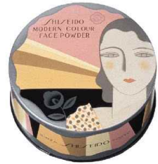
山名文夫《資生堂モダンカラー粉白粉》 1932年 資生堂企業資料館蔵

資生堂のデザイナーとして活躍した山名文夫がデザインした雑誌の挿絵やポスターを前期、後期に分けて紹介します。気品溢れる女性のイメージとデザインをお楽しみください。