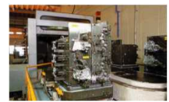
6パレットチェンジャー式 横型マシニングセンタ