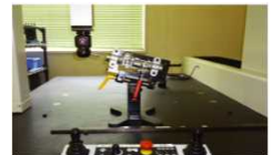
CNC3次元測定機 東京精密/ミツトヨ