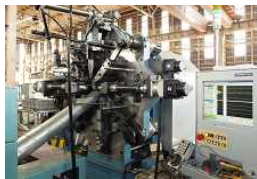
スプリングフォーマー