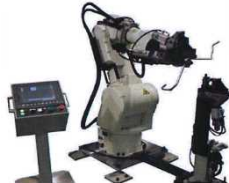
フォーミングマシン