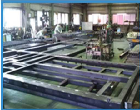
◇ 食品プラントフレーム STKR SS400 t12mm サイズ 5140×2000