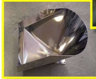
◇ ホッパー(SUS t1.5mm サイズ 500×350)