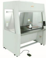
クリーンブース筐体