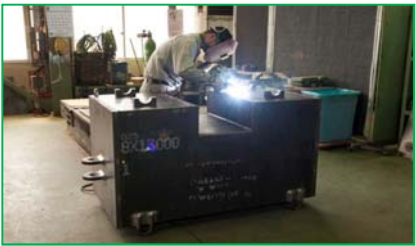
手溶接による製缶加工も可