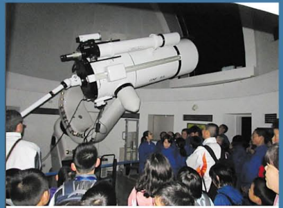
群馬県立ぐんま天文台 @tenmon10・5月23日 【夜の団体予約利用】半月状の金星、木星、月、アルクトゥールスとスピカの色比べなどをこの時期はできます。21日（木）は快晴だったので、群状星団M3まで見たり、本物の夜空で春の星座解説、星の動きの確かめもできました。

天文台ツイッターでは、天文台周辺の最新の天気状況を発信しています。来館予定の方はぜひチェックしてみてください。また、イベント情報、天文現象のおもしろ小話などもつぶやいています。