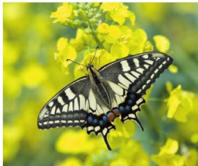
キアゲハと菜の花

3月にもなると、暖かさに誘われて昆虫たちも動き出します。ミツバチ、テントウムシ、チョウなど、早春に活発に動き始める昆虫の、身近でありながら意外と知られていない生態を、パネルやビデオで紹介。野外では、菜の花畑に集まる昆虫たちの観察ができます。