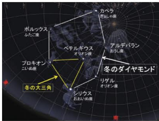
寒空にきらめく冬のダイヤモンド

ホワイトデーのプレゼントに星空のダイヤモンドはいかがでしょう。ぐんま天文台では、「冬のダイヤモンド」と呼ばれる星の並びから、冬の星座や星雲、星団をご案内します。※天候不良時中止