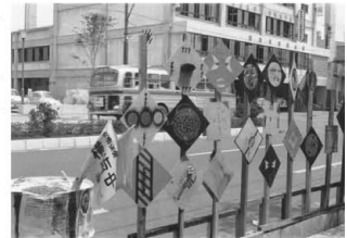
前橋ビル商店街（県庁前通、前橋）前の歩道に展示された「標識絵画」1966年7月

「群馬NOMO（ノモ）グループ」は、1960年代の前橋を拠点に、新しい表現を求めて活動しました。この展示会では、その活動の全貌を、作品や資料によって紹介します。