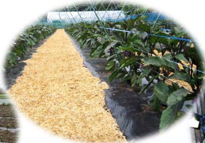
乾燥防止のための 通路への敷きわら