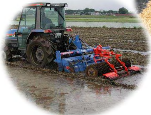
ほ場へのすきこみ