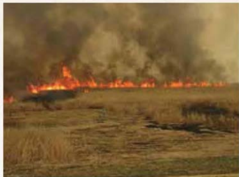
【ヨシ焼き】 良質のヨシを育て、ヨシ原を保全し植物の芽吹きを促します。