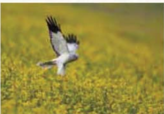
【ハイイロチュウヒ】 チュウヒなどの猛禽類を中心に約260種の鳥類が確認されています。

国土交通省 関東地方整備局 利根川上流河川事務所 調査課 電話：0480-52-3958