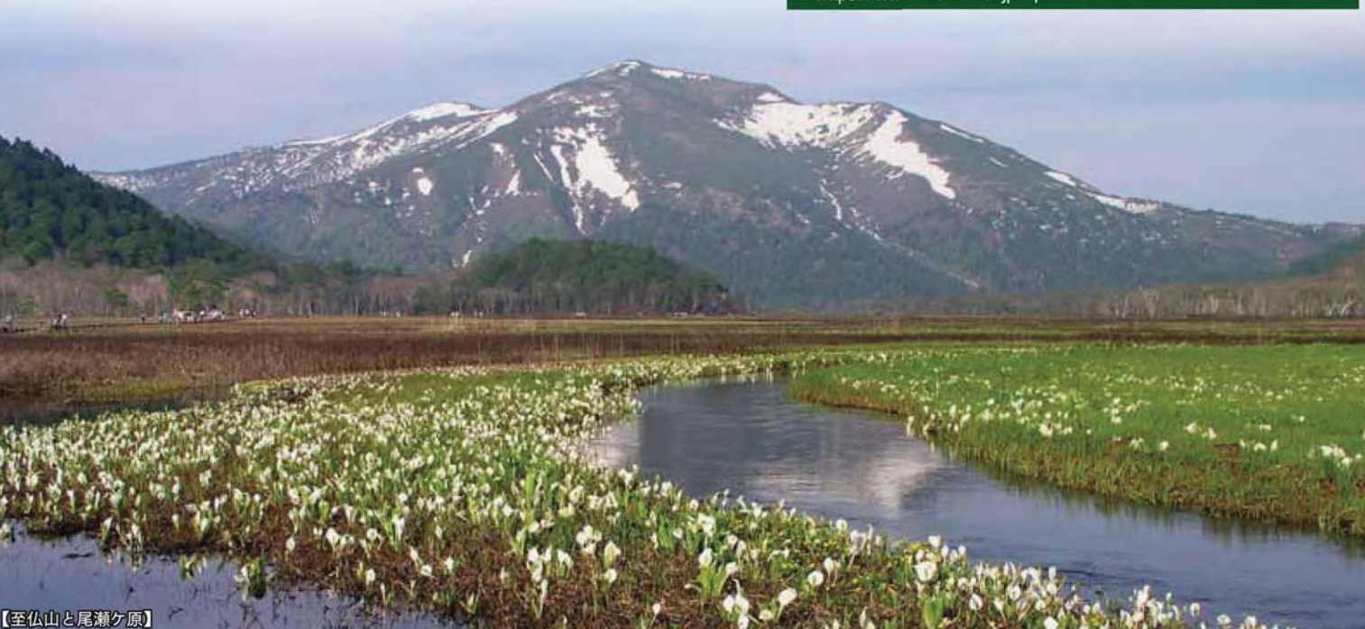
【至仏山と尾瀬ヶ原】