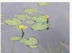
【オゼコウホネ】 日本で初めて尾瀬で発見され、水辺に生育し、尾瀬の歌にも登場。尾瀬にちなんで命名されました。する印象的な植物です。