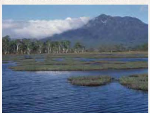
【池塘と浮島】 湿原の形成過程とも関連する特徴的な景観です。