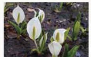
【ミスバショウ】 尾瀬の歌にも登場。尾瀬にちなんで命名されました。する印象的な植物です。

(公財) 尾瀬保護財団 電話：027-220-4431 https://www.oze-fnd.or.jp/