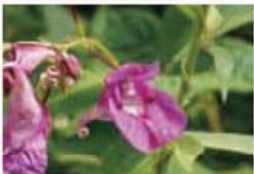
【ワタラセツリフネソウ】 約1000種類の植物が確認されており、希少な植物も多くあります。