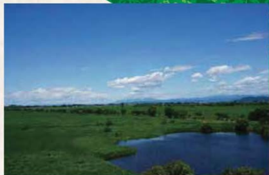
【広大なヨシ原】 ヨシ原には湿地が広がり、猛禽類の日本屈指の越冬地になっています。