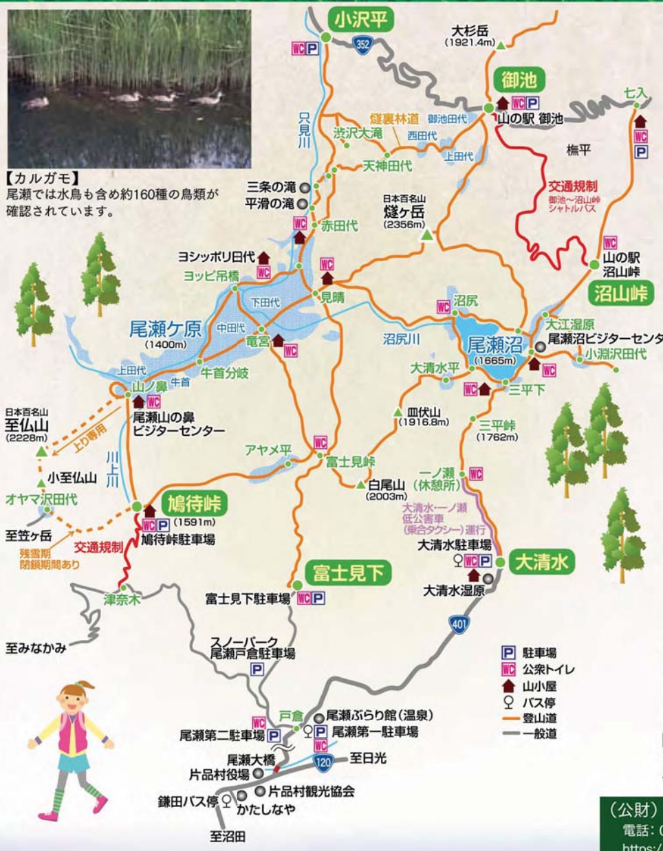
【カルガモ】 尾瀬では水鳥も含め約160種の鳥類が確認されています。

本州最大の高層湿原である尾瀬ヶ原をはじめ大小の湿原、尾瀬沼などの湖沼、河川、原生林及び2000m級の山々が豊かな生態系を形づくっています。植物相はもとより鳥類、昆虫類、ほ乳類などの動物相も多様性に富んでいます。尾瀬の大部分がラムサール条約湿地であるとともに、国立公園特別保護地区や特別天然記念物にも指定されています。