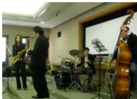
ジャズバンドの皆さん