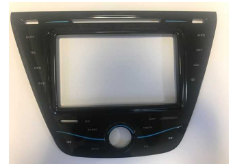
車載用パネルに採用