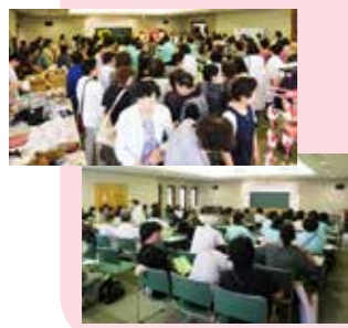
← 午後のシンポジウム風景

平成 29 年 7 月 1 日 (土) 登録団体との協働事業 子育て参画セミナー 「ほめて育てるコミュニケーション・トレーニング入門」