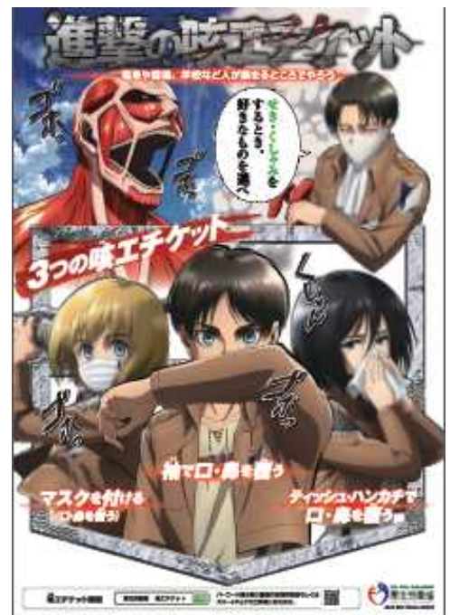
啓発ツール「進撃の咳エチケット」 (厚生労働省ホームページからダウンロードできます)

★ 県内のインフルエンザの詳しい情報はこちら: http://www.pref.gunma.jp/02/p07110015.html