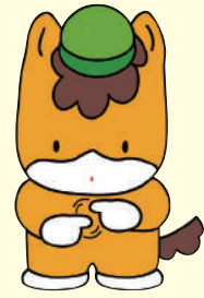
「手話」を表現している ぐんまちゃん