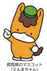
群馬県のマスコット「ぐんまちゃん」

http://www.pref.gunma.jp/03/x33g_00017.html