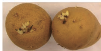
芽が出たジャガイモ