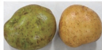
緑色に変わったジャガイモ(左)と色が変わっていないジャガイモ(右)