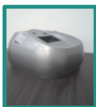
エステ機器カバー (複雑形状対応)