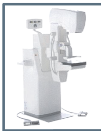
医療検査機器カバー (小ロット対応)