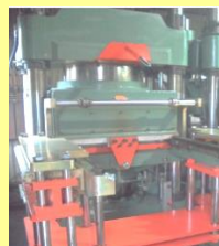
プレス成形機での製品例