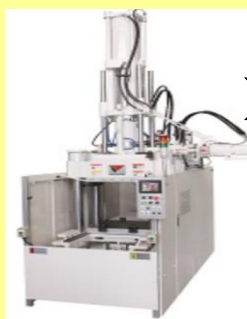
射出成形機での製品例