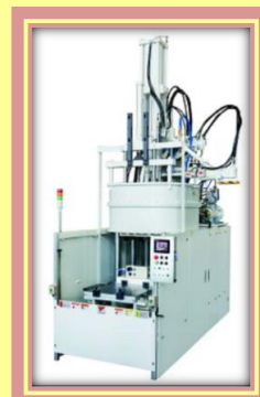
現在、真空成形製品に挑戦中！請うご期待

【開発進度】 H30.5現在 アイデア段階 試作/実験段階 開発完了段階 製品化完了段階