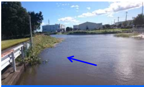
被害の状況（H29台風21号）