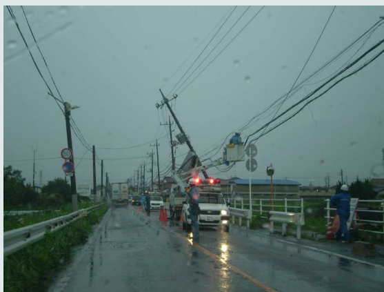
竜巻による電柱倒壊 (H21.7.27 竜巻 国道354号)