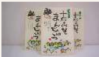
上野村農業協同組合 540円(税込)

上野村特産の十石みそを餡に練り込み、県産の地粉で包んでいます。十石みその香りとほのかな甘さが味わえるこだわりのおまんじゅうです。