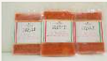
小さなパスタ屋マカロニ 240円(税込)

2時間煮込んだ自家製トマトソースに、群馬県産唐辛子の自家製辛味オイルとローストガーリック、国産バジルを加えた辛口のトマトソースです。