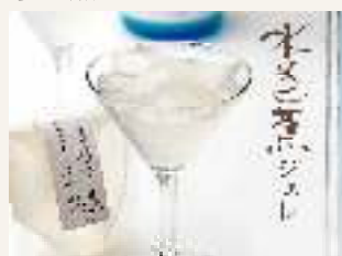
パティスリー ル・カドウ 346円(税込)

群馬の地酒、水芭蕉の純米辛口スパークリングを贅沢に使用したゼリーです。フルーティーで華やかな日本酒の風味をお楽しみいただけます。