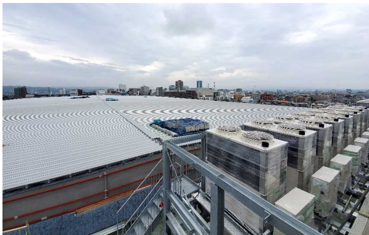
△ 展示ホール屋根と屋上の空調設備機器の様子

展示ホールの屋根工事が概ね完了しました。今後、展示ホール屋根面で太陽光発電パネル設置工事を予定しています。また、会議施設の屋上に空調設備機器を設置しました。