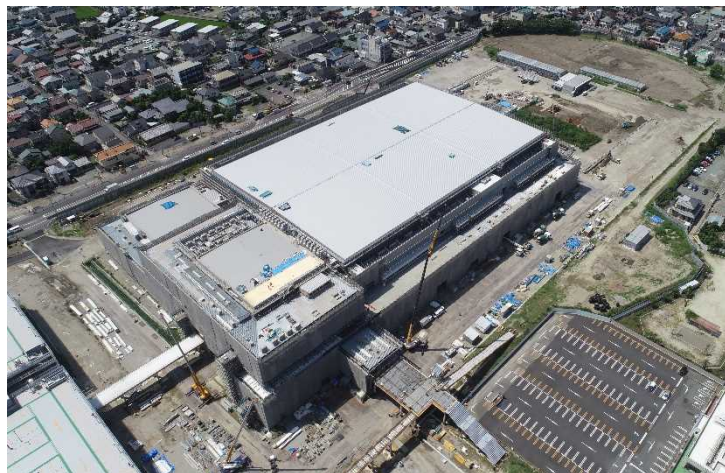
△ 敷地上空からの工事の様子（会議・展示施設）