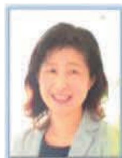
株式会社リンクス人事コンサルティング 特定社会保険労務士 (公財)介護労働安定センター群馬支所 介護人材育成コンサルタント

能力開発啓発セミナーは、介護労働者のキャリア開発に取り組む事業主又は人材育成を行う管理職を支援し、相談援助を行う公益金事業【研修コーディネイト事業】の一環として、介護人材育成の取組みに関するテーマで、年2回開催するものです。