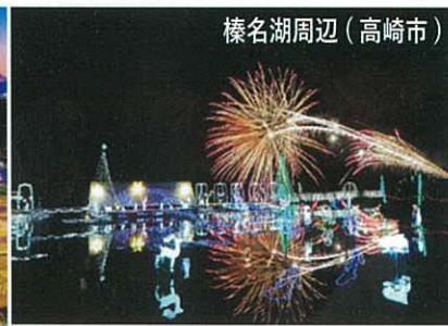
榛名湖周辺 (高崎市)

◇ 年未年始のお知らせ ◇ 物産販売 12/31 ~ 1/3 休業 観光案内 12/31 ~ 1/3 休業 レストラン 12/30 ~ 1/5 休業