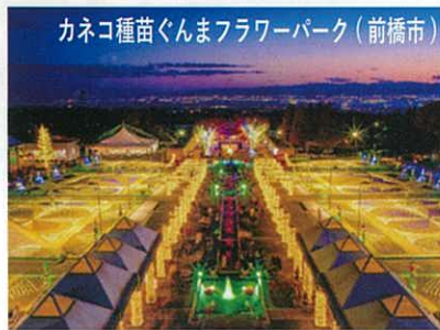
カネコ種苗ぐんまフラワーパーク (前橋市)