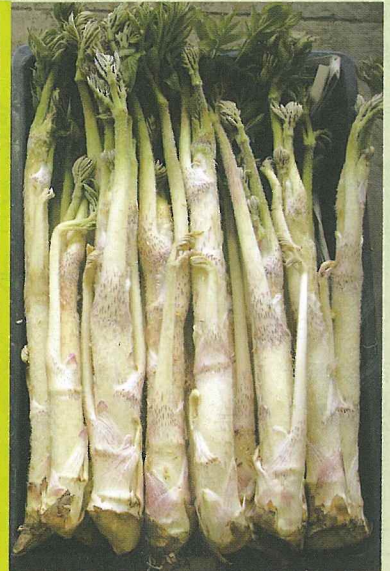
新品種「利根白」(左)、在来「紫」(右)

ウド新品種「利根白」は、群馬県在来「紫」の自然交配実生から選抜しました。太くて赤みが少ない茎が特徴で、アクが少なく柔らかいことから、サラダにも適しています。平成23年2月から本格出荷が始まります。