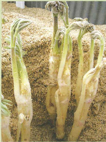
伏せ込み床 (もみで軟白化)