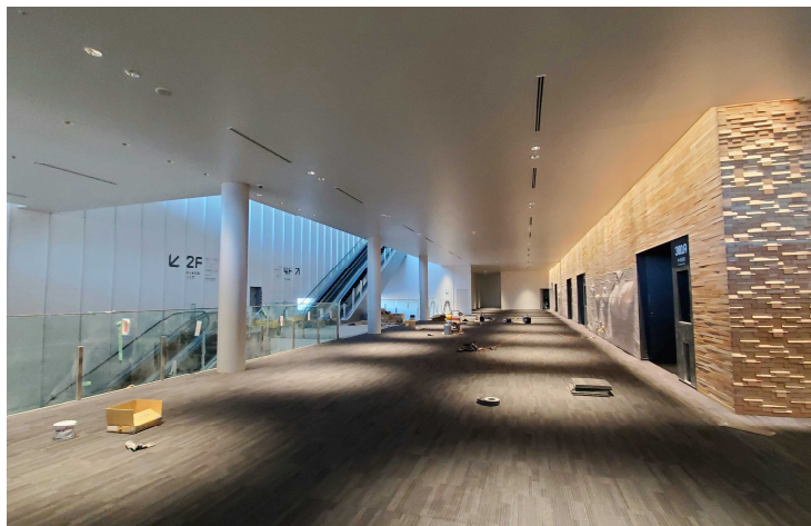
△ 会議施設 3階の様子

会議・展示施設、立体駐車場は概ね順調に工事が進み、内装工事や設備工事等の工程もあつたわづかとなりました。展示施設の屋根では、太陽光パネルの設置が完了しました。