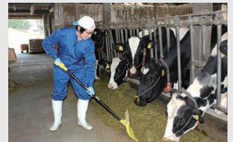
牛達に試験飼料を与えています

畜産職の業務内容は家畜の飼養管理、試験研究など多岐にわたります。国内でも上位の畜産生産を誇る群馬県の畜産農家や関係機関への支援・指導により、県内畜産業を盛り上げていけることにやりがいを感じています。