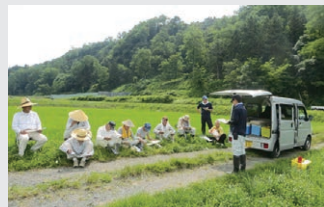
現地講習会で水稻の栽培管理のアドバイスをしています

農業職の一番のやりがいは、生産者と直接やりとりをしながら、問題解決に向けて一緒に仕事ができることだと思います。お手伝いした生産者から「ありがとう」と感謝されたときは、「この仕事をやってよかった」と感じます。