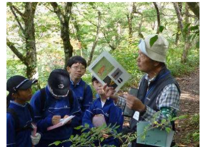
「緑のインタープリター」 の活動状況