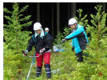
森林ボランティア体験