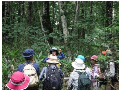
フォローアップ研修