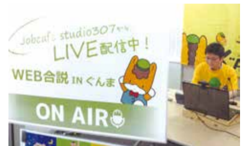
ジョブカフェぐんまからライブ配信