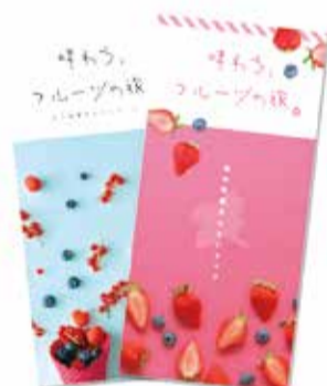
手に取りたくなる2種類の表紙