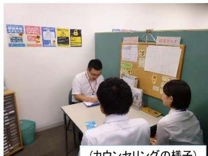
（カウンセリングの様子）