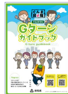
(学生向け就職情報誌)