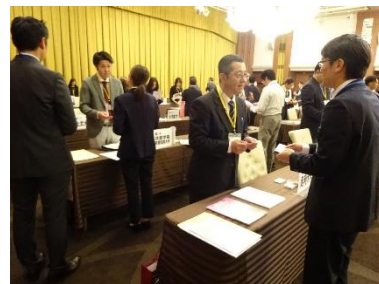
（大学と企業の交流会）