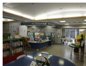
(ジョブカフェぐんま東毛サテライト)