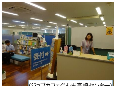
（ジョブカフェぐんま高崎センター）

来所者：のべ28万人以上 就職者：19,000人以上 （平成16年7月の開設以降の相談実績）