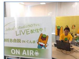
(オンライン合同企業説明会)