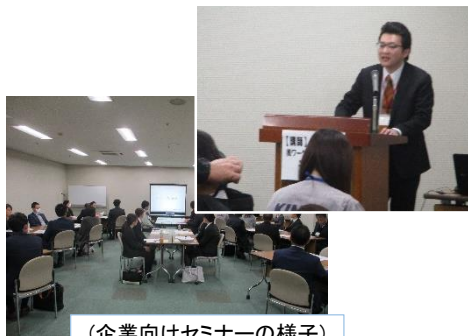
（企業向けセミナーの様子）