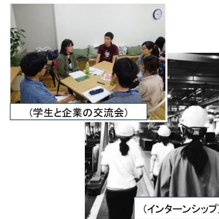
（学生と企業の交流会）