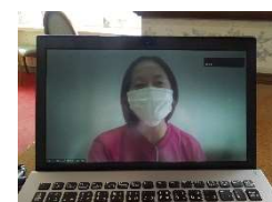
オンラインワークショップの様子