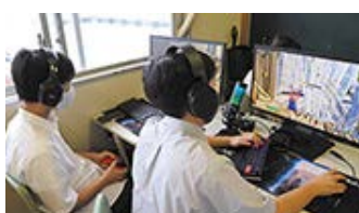
部活動でeスポーツの練習をする常磐高校の生徒たち

県内でもeスポーツを部活動として実施している高校がある他、特別支援学校においてもeスポーツの特長や仕事について学ぶ授業を実施するなど、子どもたちの能力を伸ばすための取り組みが進められています。