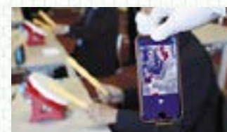
サーモグラフィーでゲーム前後の体の温度を計測

生体工学の研究者として、高齢者のeスポーツ活用に向けた実証事業に参加しました。唾液の成分分析などにより、ゲーム前後の体の反応を測定したところ、10分間ゲームを行っただけで脳神経が大きく活性化されました。また「太鼓の達人」など実際に体を動かすゲームをすることで、狙った部位の筋肉を鍛えるトレーニングにもつながることが分かりました。実際に桐生市の高齢者施設では、来春からeスポーツを取り入れたサービスが始まり、その監修を行う予定です。