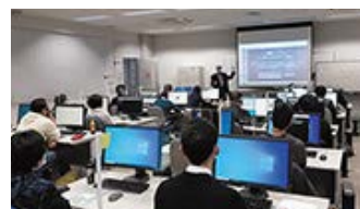
eスポーツの周辺産業の実務的な講習を実施

eスポーツを通してPCなどのデジタルツールを使いこなしたり、コミュニケーション能力や戦略的思考などを育んだりすることで、IT分野などへの就職に生かすことができると考えられます。また大会の開催は、イベント運営や照明、音響などさまざまな周辺産業を活性化し、雇用の拡大にもつながります。県はeスポーツ関連の就職セミナーや研修を実施し、人材の育成と県内企業への就職を促進しています。