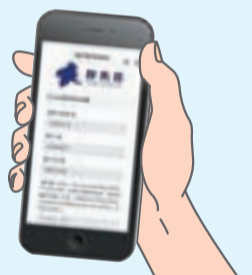
ぐんまワクチン手帳 画面イメージ

新型コロナウイルスワクチンの接種を受けた本人の接種の記録をスマートフォンなどに表示するもので、紙の接種済証や接種記録書と同じ記録を表示させるものです。紙の接種済証などと異なり、紛失の恐れが少ないため、持ち運び提示するのに便利です。