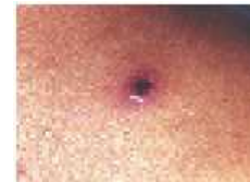
刺し口の例