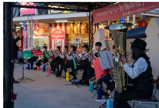
写真2 昨年のイベントの様子 （地元高校生の吹奏楽部による演奏）