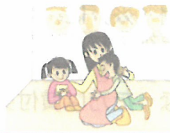
子どもを預けるための費用

※この他にもご利用いただける費用がありますので、詳細は下のお問い合わせ先でご確認ください。