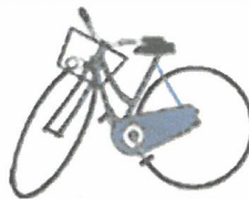
通勤用自転車・バイク等購入費