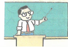
研修会受講料や図書費、 介護福祉士試験受験手数料等