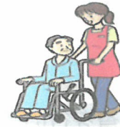
介護ウエアなどの業務用被服費