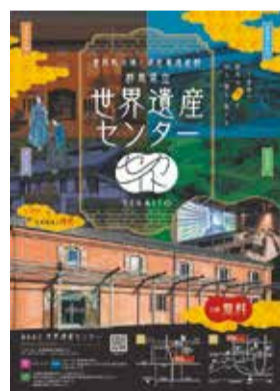
このポスターを見つけよう!