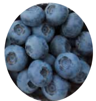
知事賞のブルーベリー