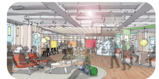
群馬県庁32F イノベーションハブ *1