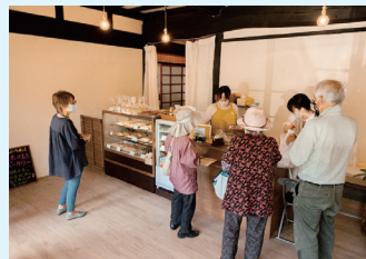
古民家の雰囲気が残る店内

私達は平成31年4月から家族で埼玉から移住し、みどり市地域おこし協力隊の農業振興担当として活動を始めました。主人の農業経験を活かし、「小麦を栽培し、その小麦を挽き粉にして、パンを作って販売する」という6次産業化を目指し計画を進めました。