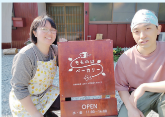
もものはベーカリーです！