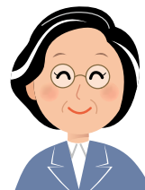
特別支援教育 コーディネーター しさん

十分な学びができるよう、一人ひとりの障害の程度や発達の段階に応じた指導を、以下のように行っています。