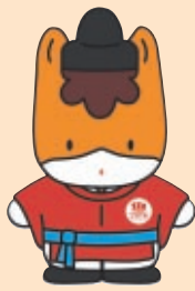
群馬県のマスコット「ぐんまちゃん」