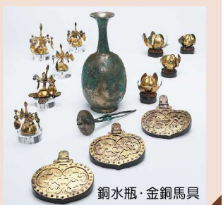
銅水瓶・金銅馬具