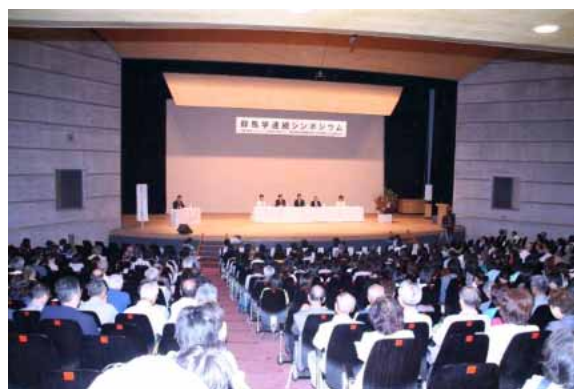
群馬学シンポジウムの様子

平成21年度からは「群馬学センター」を設置し、人的交流の促進や情報の収集・発信機能を充実させ、様々な視点から群馬の魅力を県民とともに掘り下げていきます。