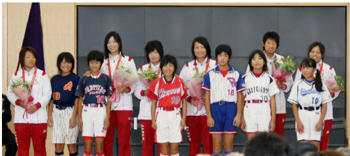
北京五輪金メダリストとジュニア選手