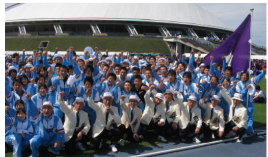
健闘を誓う本県国体選手