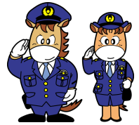
上州くん みやまちゃん

追越車線は、前車を追い越すために設けられた車線です。 走行車線に通行車両がないのに、追越車線を走行していると、 ・ 追いついた車両は左側から追い越す ・ 遅い場合、後続車が十分な車間距離を保たず走行する 等、極めて危険性・迷惑性が高いため、取締りを強化しています。