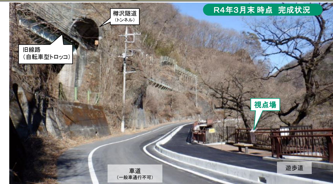
山側は旧線路を走る自転車型トロッコ、川側は吾妻渓谷を展望できる視点場として整備