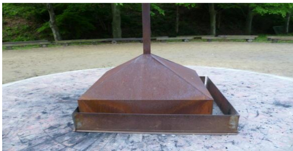
煙突フード 風除け鉄柵