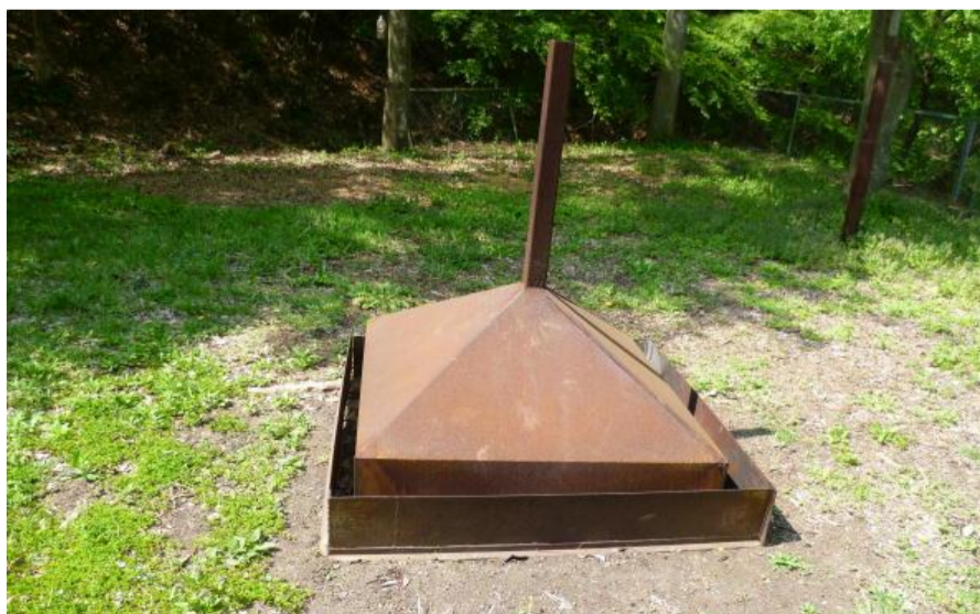
清掃後の煙突フードと風除け鉄柵