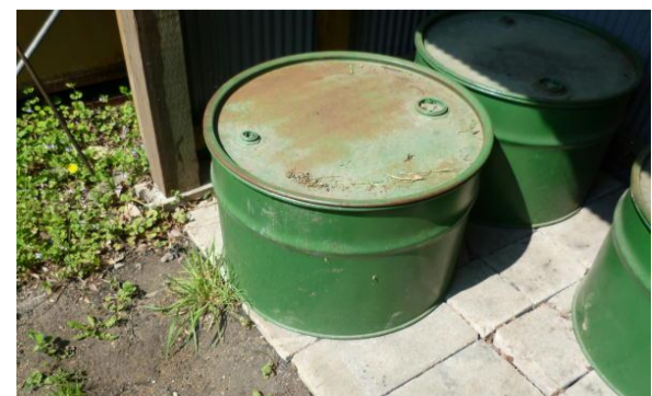
燃え残った薪を入れるドラム缶