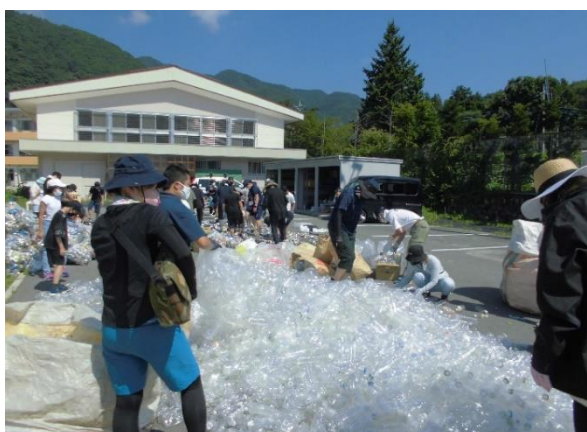
イー5 山のようなペットボトルですが、みんなてつぶして、麻の袋(イー6)に入れます。