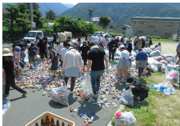
イー4 分別したアルミ缶はつぶして再度袋に入れて業者に引き渡します。