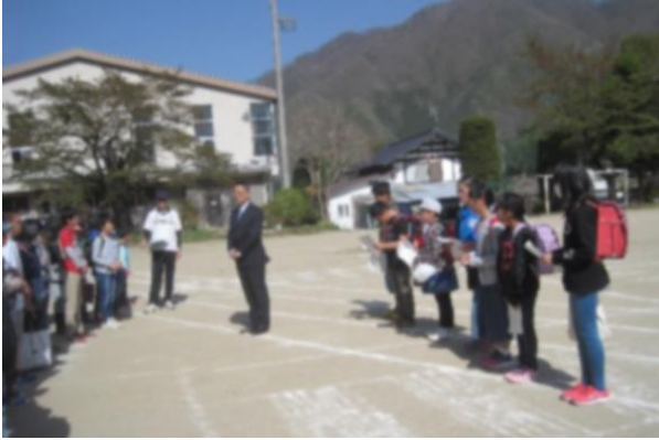
ア-1 始める前の集会