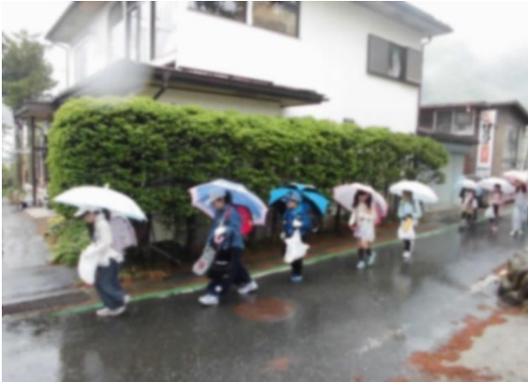
ア-3 雨の降る年もありましたが、通学班で列を作り交通安全に気をつけて活動しました。

「安全に気を付けながら、自分達の住む地域の美化に努めるようにがんばりましょう。」