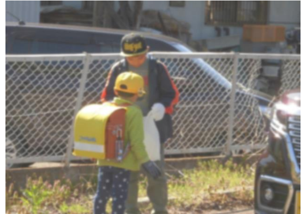
ア-4 上級生がビニール袋を用意し、下級生が拾ったゴミも一緒に集めます。