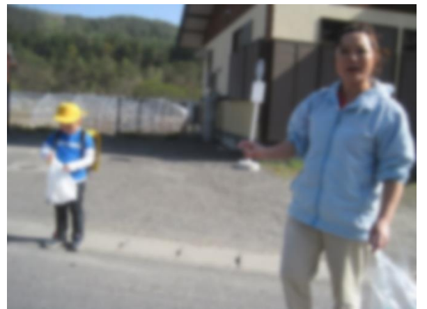
ア-6 途中で保護者も参加してくれました。