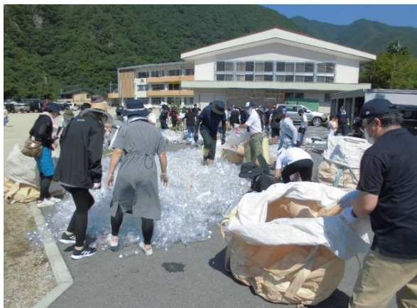
イー1 児童とPTAがともに活動します