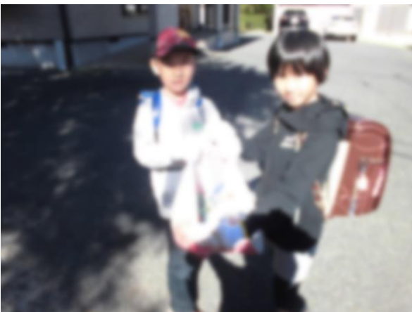
ア-5 「こんなにたくさん拾えたよ！通学路がきれいになりました。」