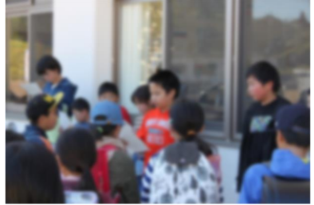
ア-2 環境委員から、注意点と活動の目標について説明があります

「安全に気を付けながら、自分達の住む地域の美化に努めるようにがんばりましょう。」