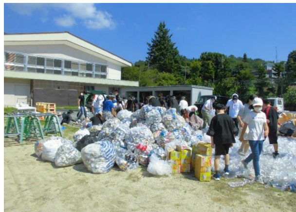
イー2 各地区から資源物が集められます