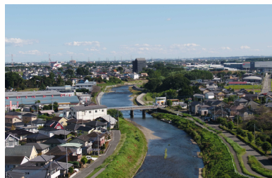
第一級河川 井野川 河川改修 (高崎市)