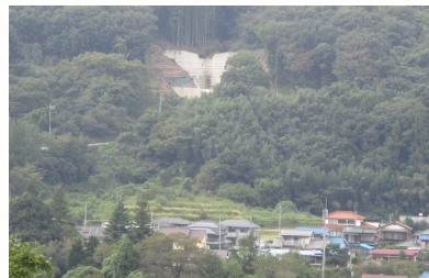
渡良瀬川水系 中井沢 砂防堰堤 (みどり市)