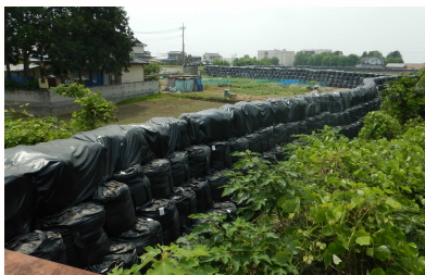
第一級河川 八瀬川 土嚢による堤防緊急嵩上げ (太田市)