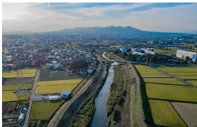
第一級河川 桃ノ木川 河川改修 (前橋市)