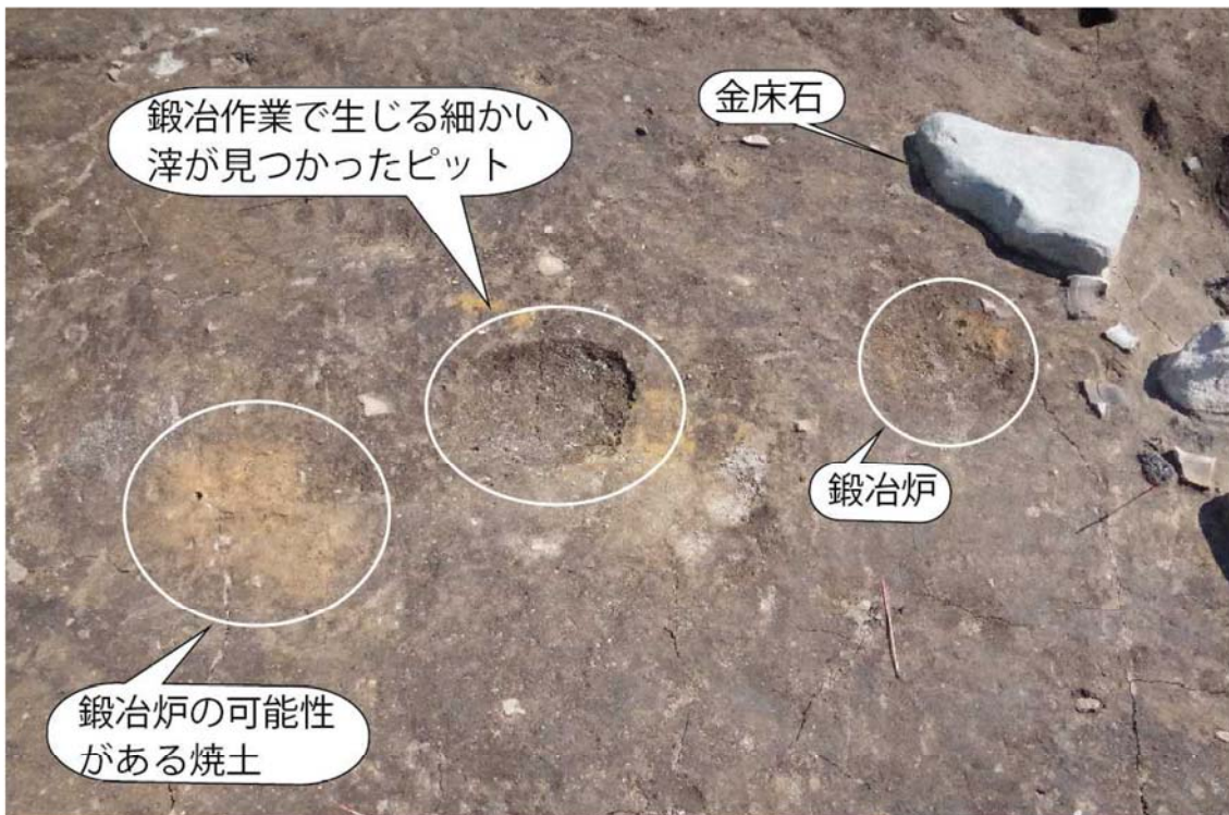
写真7 平地式建物内の鍛冶遺構