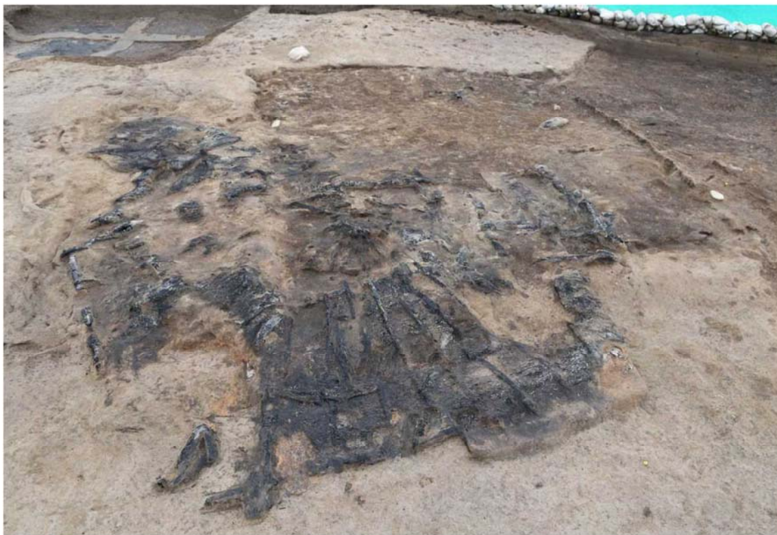
写真5 平地式建物全景 右上に方形の建物跡があり、火砕流によって左下方方向に倒壊した屋根が良好な状態で残る。