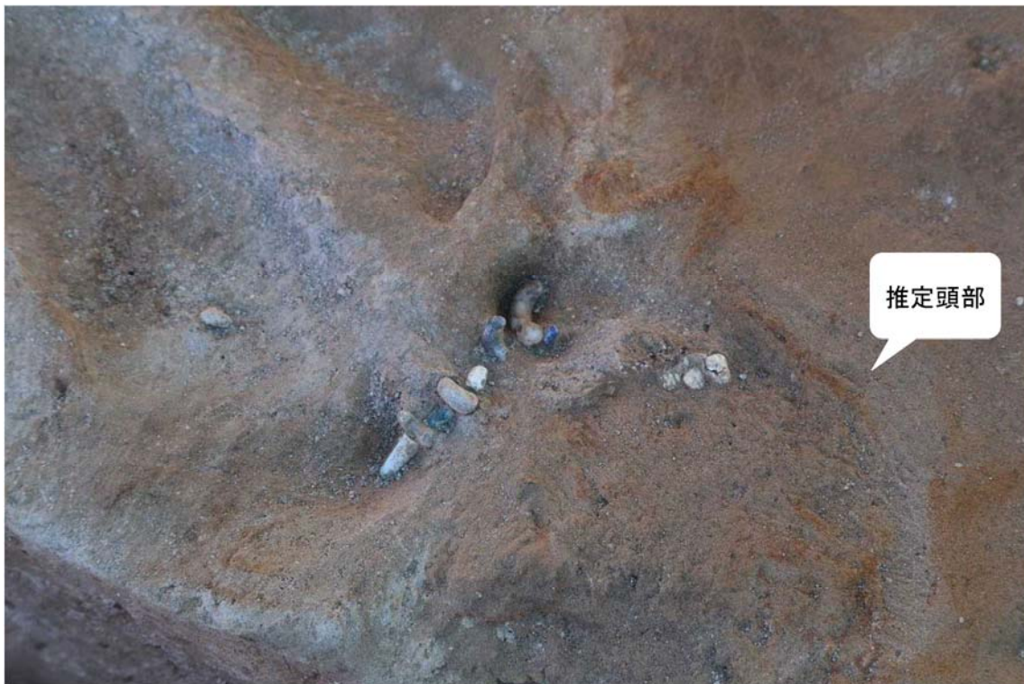
写真4 首飾りの古墳人 頭部付近近接 首飾りが弧を描いて地中に続く。