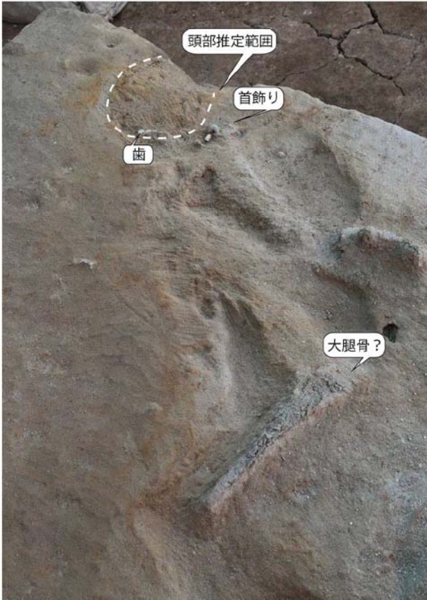
写真2 首飾りの古墳人確認状態