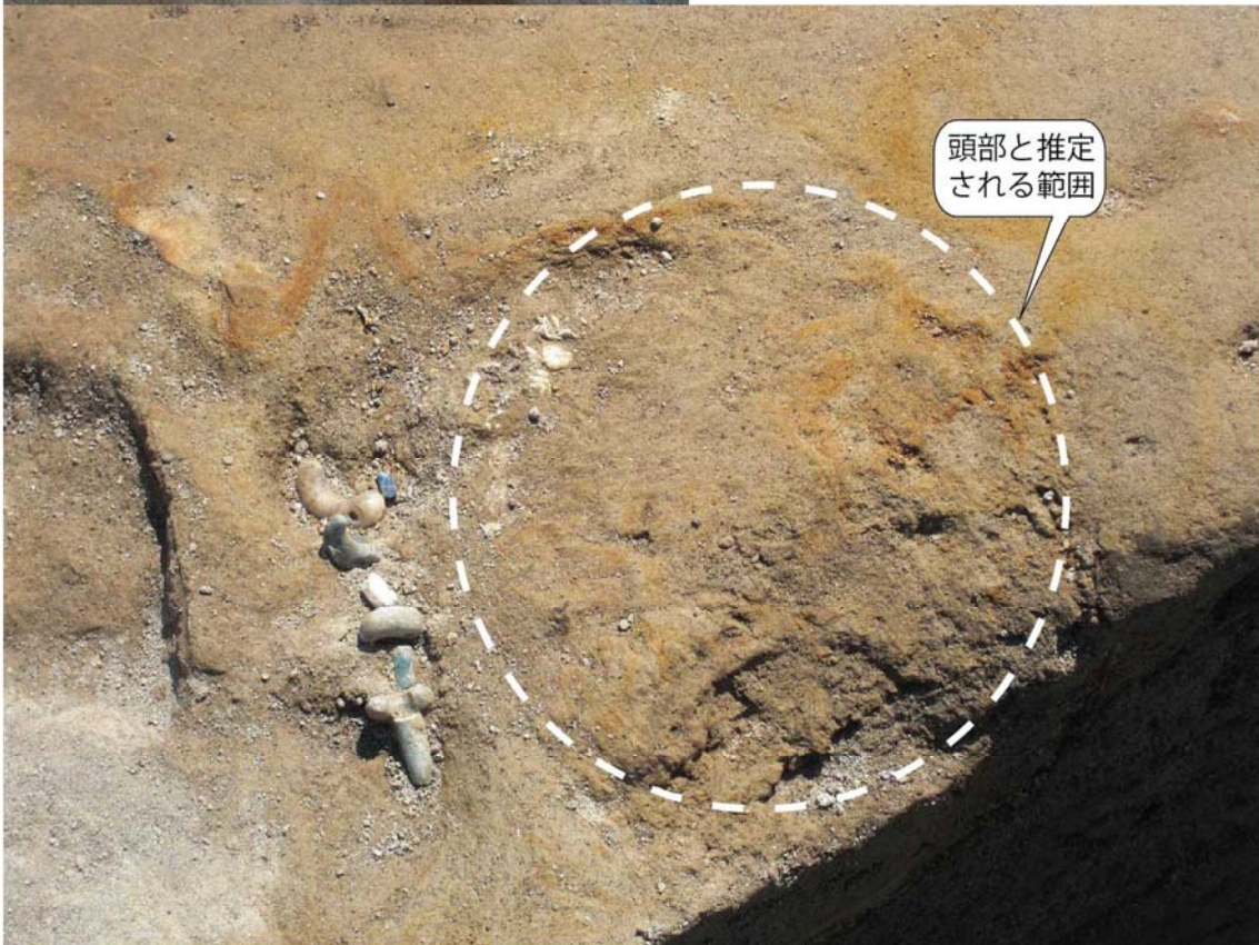
写真3 首飾りの古墳人 頭部付近近接