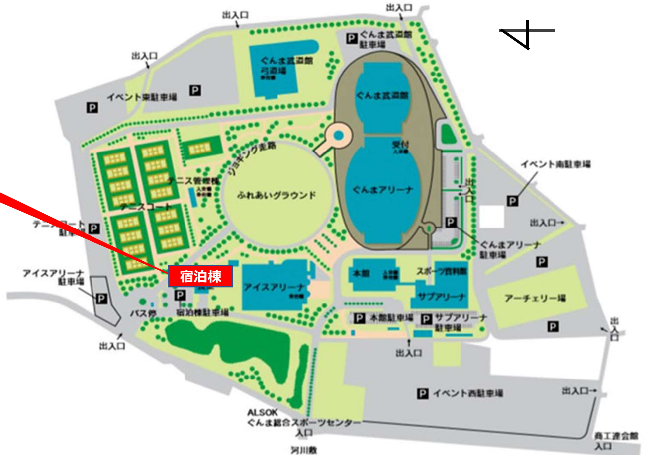
ALSOKぐんま総合スポーツセンター