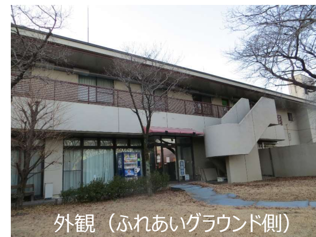
外観（ふれあいグラウンド側）